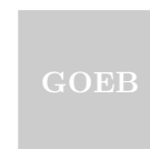
GOEB Gebruiksoppervlakte Externe Bergruimte