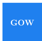
GOW Gebruiksoppervlakte Wonen